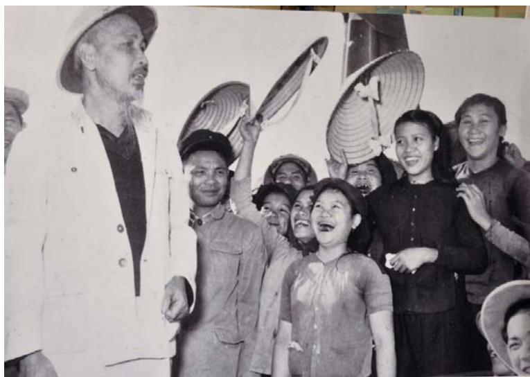
Ảnh: Chủ tịch Hồ Chí Minh thăm hỏi chị em dân công lao động đào mương chống hạn ở Từ Liêm, Hà Nội, ngày 16/12/1958

... Thấy Bác đứng dưới bóng cây mát, chúng tôi đến vây quanh Bác, đồng chí Bộ trưởng cũng đến đứng gần Bác.