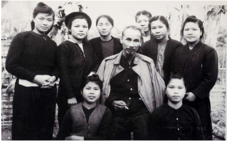
Ảnh: Chủ tịch Hồ Chí Minh với các cán bộ cơ quan TW Hội Liên hiệp Phụ nữ Việt Nam ở Việt Bắc, tháng 2/1949

Chủ nhật trước ngày 2 tháng 9 năm 1958, một số chị em trong cơ quan Thành hội Phụ nữ đã đi phổ sấm sửa cho ngày lễ. Nhưng khu tập thể vẫn đông vui vì hôm đấy không chỉ có các ông chồng về chơi, mà nhiều chị em còn đón cả bố mẹ ở quê ra dự ngày hội lớn ở Thủ đô. Mọi người không ngờ đã được Bác Hồ đến thăm. Xe vừa đỗ, Bác nhanh nhẹn bước xuống. Các chị trong cơ quan mừng quá, ùa ra đón, mời Bác vào phòng khách, nhưng Bác không vào mà nói: