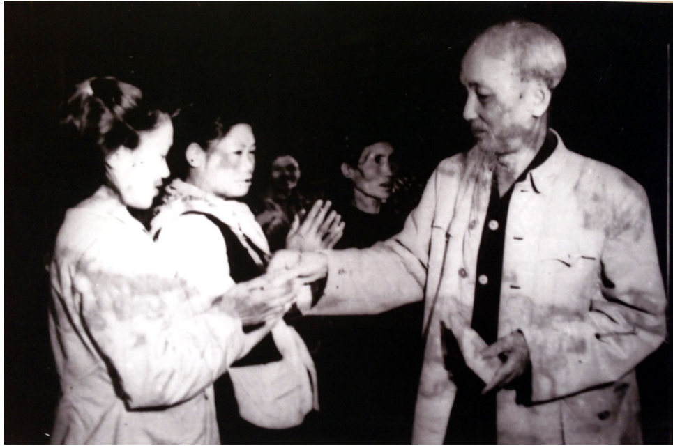
Ảnh: Chủ tịch Hồ Chí Minh trao huy hiệu cho đại biểu có nhiều thành tích tại Đại hội Những người xuất sắc trong phong trào "Ba đảm đang" của phụ nữ Thủ đô ngày 2/12/1965

Đại hội Ba đảm đang của phụ nữ Thủ đô lần thứ nhất, khai mạc rất trọng thể vào tối 1-12-1965 tại hội trường Trường Đảng cao cấp Nguyễn Ái Quốc. Chiều 2-12-1965 (ngày họp thứ 2) vào khoảng 16 giờ, Đại hội vô cùng sung sướng, phấn khởi được đón Bác. Cùng đi với Người có Thủ tướng Phạm Văn Đồng và Anh hùng miền Nam Tạ Thị Kiều. Vừa thấy Bác, cả Hội trường đứng bật dậy, vỗ tay ran như sấm lặn với tiếng reo vô cùng phấn khởi.