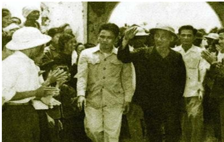
Ảnh: Bác Hồ đi thăm một hợp tác xã ở Nam Định năm 1959