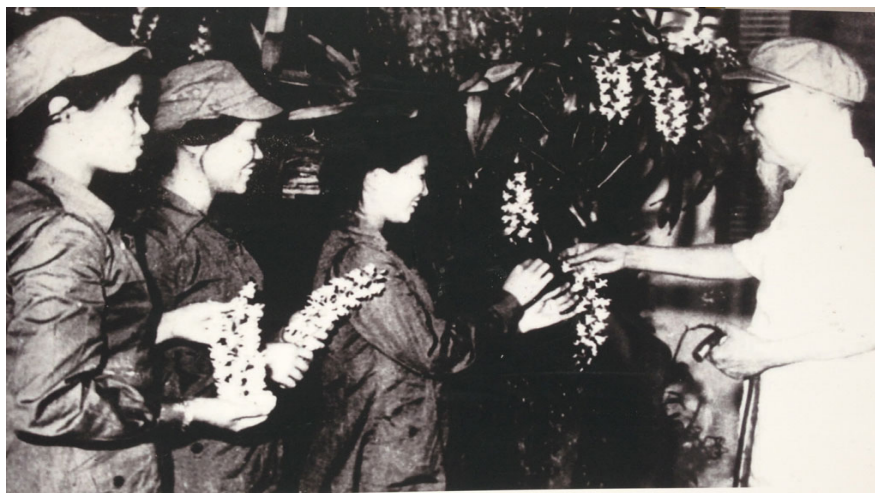
Ảnh: Chủ tịch Hồ Chí Minh tặng hoa phong lan cho ba đại biểu nữ dân quân Quảng Bình và Vĩnh Linh, năm 1968